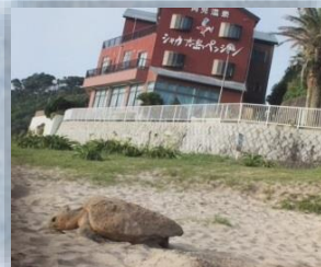
産卵するウミガメ