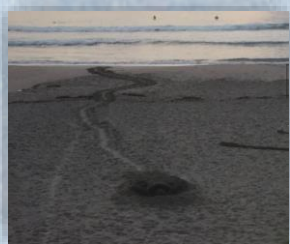
毎年6月～7月に海亀が産卵のため上陸