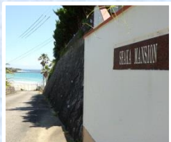
マンションからの景色