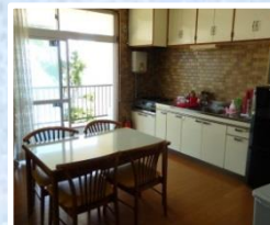
ダイニング キッチン