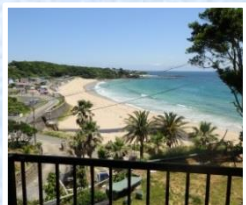
ベランダからの景色